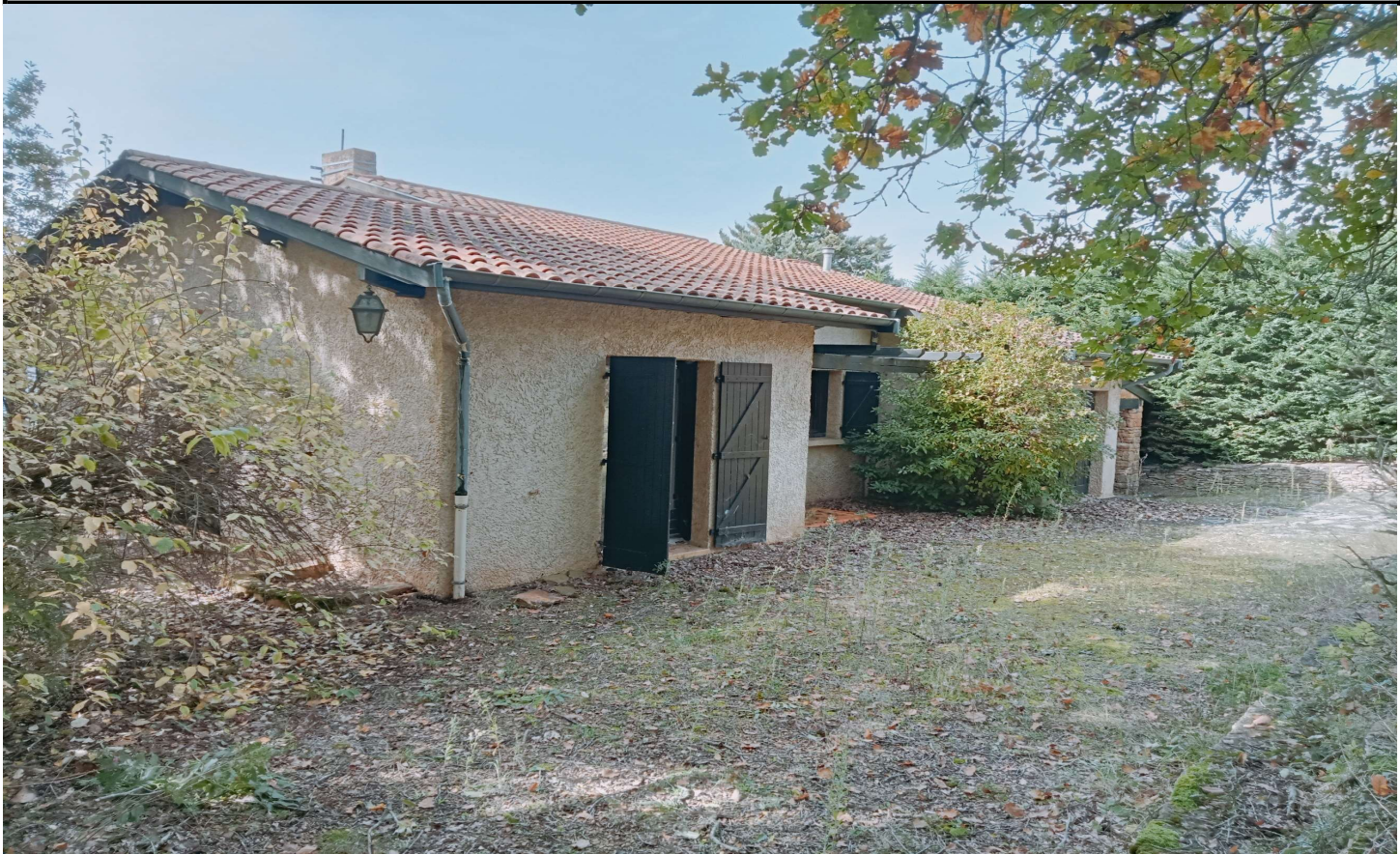
PHOTO DE L'HABITATION

Les 6 chéneaux de l'habitation et 2 grilles se déversent sur les eaux usées.